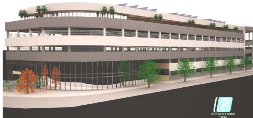
Слика скице изгледа гараже из правца кружне раскрснице