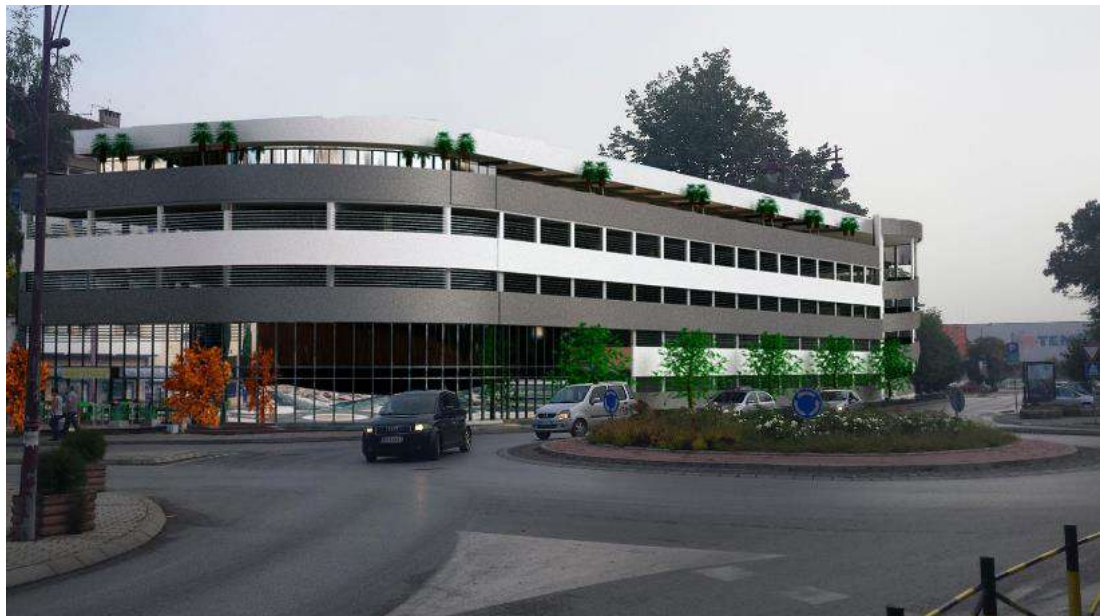
Слика изгледа прве јавне гараже код Такси станице

Пошто поменута катастарска парцела обухвата шире подручје око локације која је предвиђена за изградњу јавне гараже, потребно је да инвеститор изради урбанистички пројекат на основу кога ће се извршити препарцелација односно цепање постојеће парцеле и део парцеле предвиђено планом за изградњу гараже оформити као посебну катастарску парцелу. Тек након ових активности и на основу катастарско топографског плана те новоформиране парцеле могуће је овај пројекат имплементирати у идејно решење које је потребно за издавање локацијских услова.