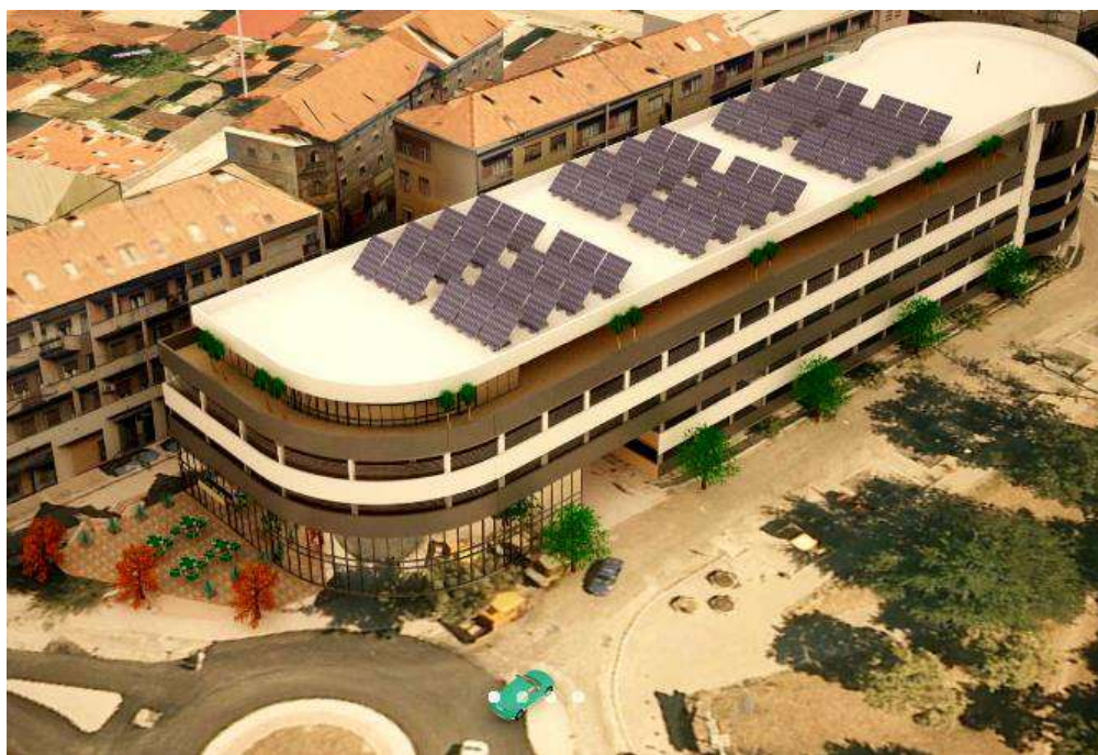
Слика предвиђене Прве јавне гараже у Чачку из Идејног пројекта

Објекат јавне гараже је армирано-бетонска скелетна конструкција. Фундирање ће бити извршено на армирано-бетонској темељној плочи дп=50цм. Дубина фундирања износи -1,00м.